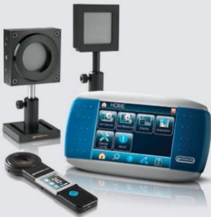
■ PUISSANCE ET ÉNERGIE LASER