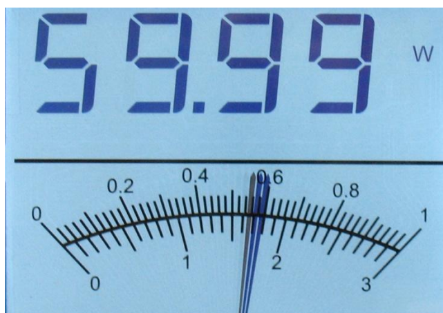
Illustration 1-4 Affichage de l'aiguille en mode traînée

La partie inférieure de l'écran affiche les valeurs prises à partir des mesures, en présentant une aiguille par-dessus une échelle analogique. Les deux images suivantes illustrent l'aiguille en mode d'affichage « traînée » et « graphique à barres », respectivement.