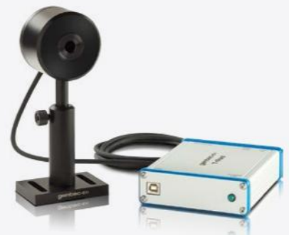
■ MESUREURS THZ