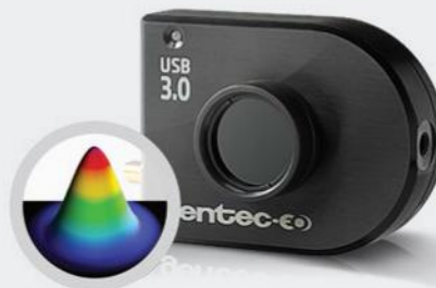
■ PROFILOMÉTRIE LASER