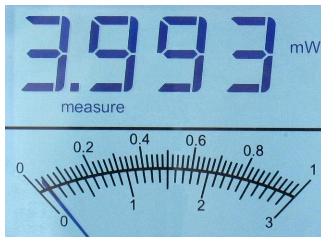
Illustration 1-3 Affichage ACL du TUNER

L'écran ACL fournit de l'information sur la mesure, la longueur d'onde, l'échelle, et d'autres messages utiles.