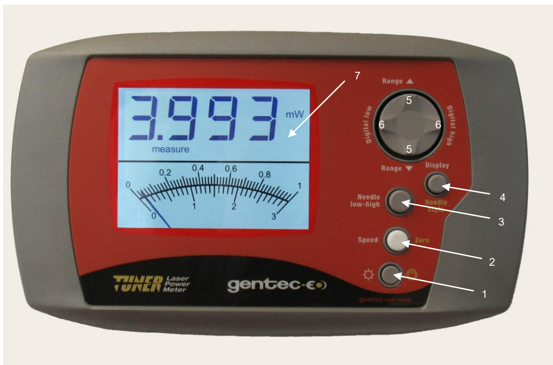
Illustration 1-1 Panneau avant du TUNER