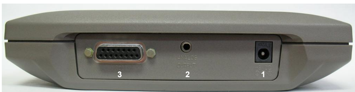
Illustration 1-2 Connecteurs du TUNER