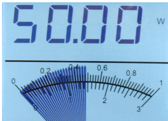
Illustration 1-5 Affichage de l'aiguille en mode graphique à barres

Lorsque les batteries sont épuisées suffisamment pour compromettre la mesure, le TUNER affiche « LO BATT » (batterie faible) à la place de la mesure. Se reporter à la section 3 pour obtenir de l'information sur le remplacement des piles.